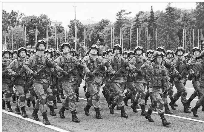
ВОЕННЫЕ В ЭКИПИРОВКЕ «РАТНИК». ЕЩЕ ЕЕ НАЗЫВАЮТ «ФОРМА СОЛДАТА БУДУЩЕГО».