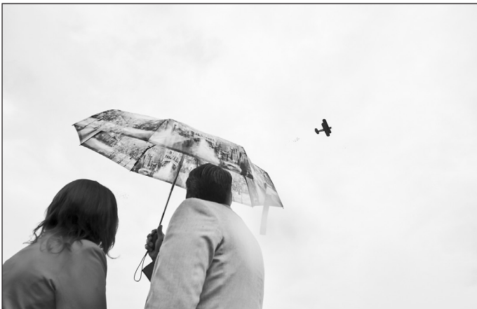
В НЕБЕ — ЛЕГЕНДАРНЫЙ «КУКУРУЗИК».