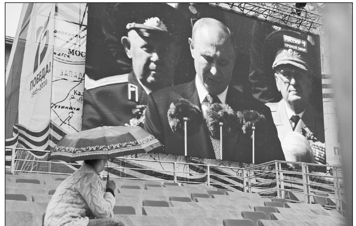
ПРЯМОЕ ВКЛЮЧЕНИЕ С КРАСНОЙ ПЛОЩАДИ СОСТОЯЛОСЬ В КОНЦЕ ПАРАДА.